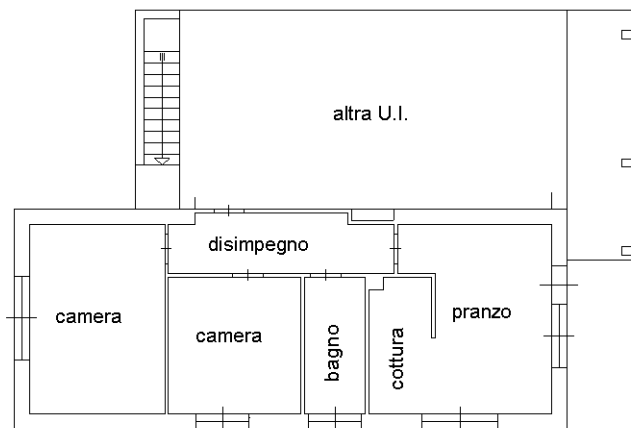
PIANTA PIANO TERRA H=320